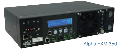
Alpha FXM 350