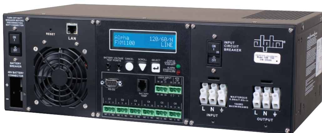
Bild: FXM 1100

Outdoor- USV mit 350, 650, 1100 und 2000 Watt Ausgangsleistung