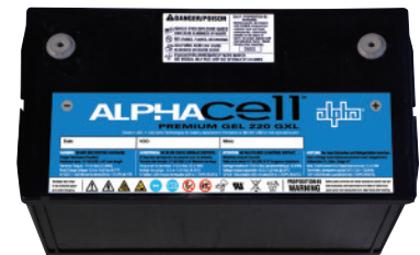
AlphaCell GEL Batterien für den Außen-Einsatz